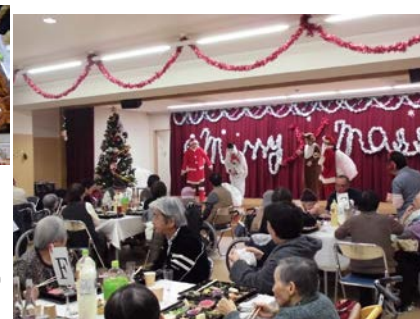
クリスマスと言えば チキン！！