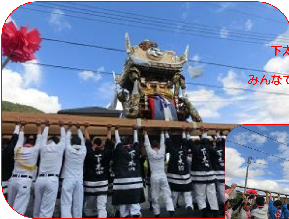
下太田秋祭り見学