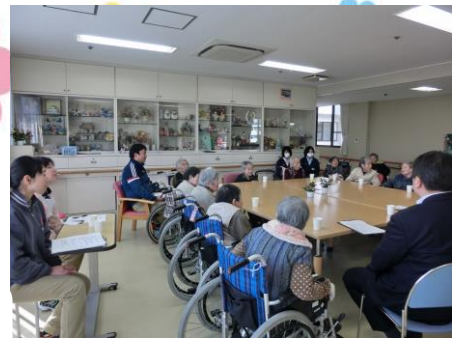
2月15日(水) 入居者様との意見交換会

今年も恒例の、入居者さまと施設長、事務長管理栄養士、看護師、介護主任、生活相談員が参加し、ふだんの生活の中で入居者の皆様が感じている事、してみたい事、困っている事など自由に発言していただく場を設け、みんなで話し合いをしました。特に多かった意見は食事に関するものが多く、昨年はお寿司を食べたいとの意見が多かったので、出前寿司をはじめ、節分やひな祭りなどの行事や誕生会にはお寿司を提供しています。日々の生活の中で食事は大きな楽しみのひとつです。今後も健康管理に努めつつ満足していただけるよう努力していきます。