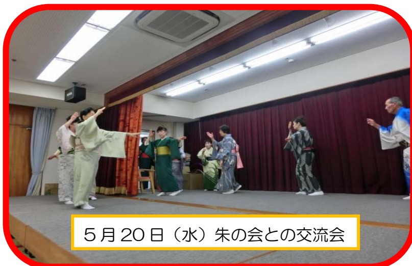
5月20日(水) 朱の会との交流会