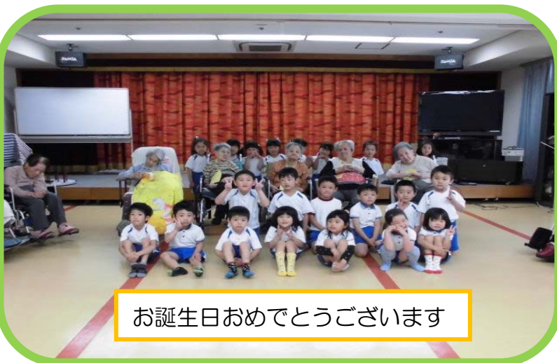
お誕生日おめでとうございます

お化粧品クラブでの記念撮影です。新任職員が 頑張って?きれいに お化粧しました(*^-^*)。とても意欲的で、鏡を見ては、微笑んでおられました。