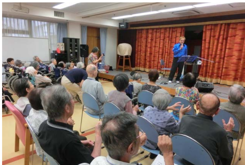
10月10日(金) 虹いろの風さんとの交流会