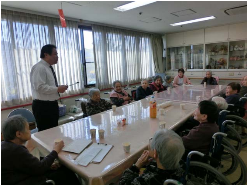
(利用者様との意見交換会 2月5日)