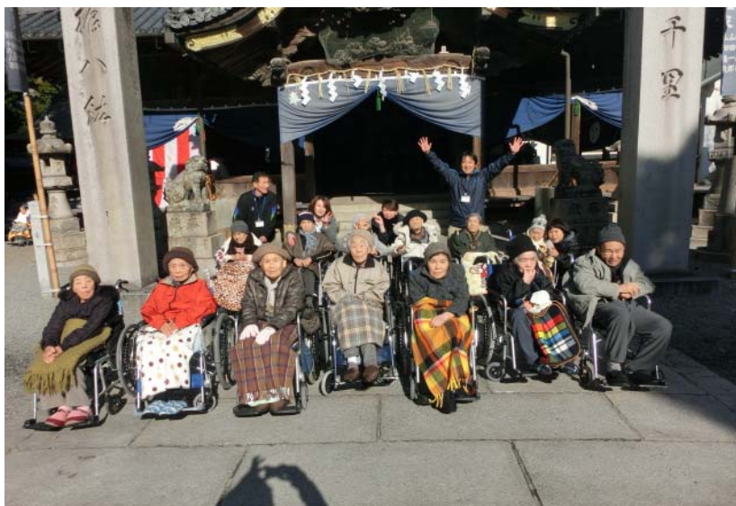
(魚吹八幡神社へ初詣 1月6日)