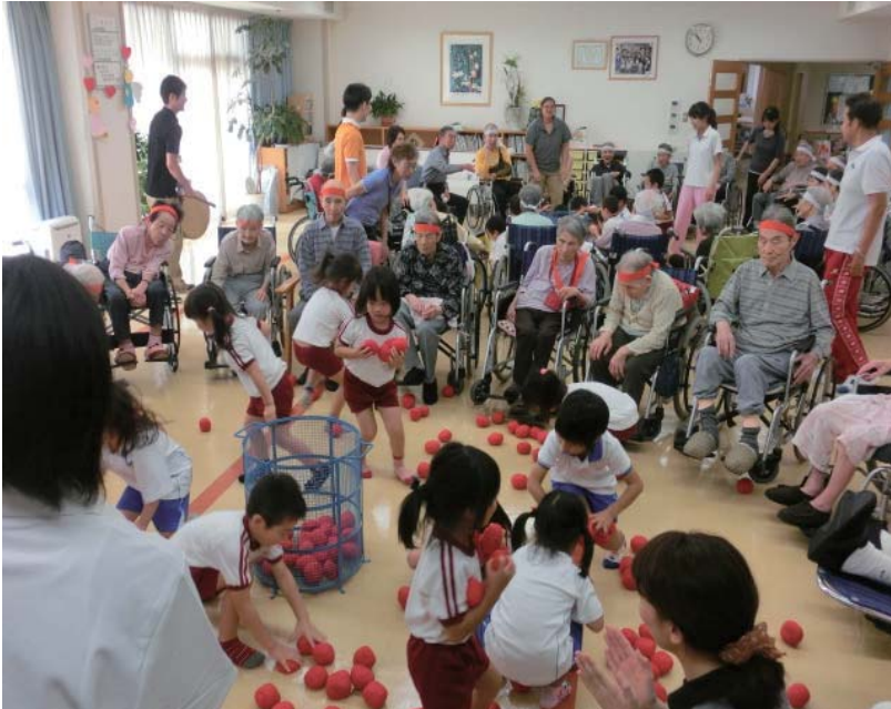
やながせ保育園児とふれあい運動会(10月10日)

にぎやかな秋が足早に通り過ぎ、晩秋と冬の訪れを感じる季節となりました。皆様におかれましては、ますますご健勝にお過ごしのことと存じます。