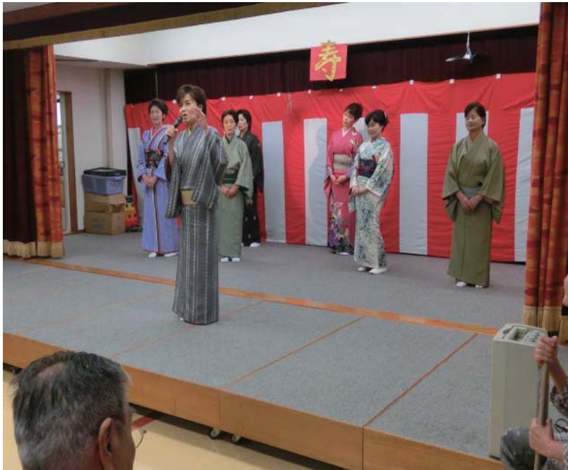
寿会（9月16日）岩波右扇会との交流会

今年も敬老の日に「寿会」を実施致しました。右扇会の皆さんも施設まで足を運んで下さり、日頃練習しておられる踊りを見せて下さいました。綺麗に着飾って美しい舞を見せて頂いたので皆さんの手拍子や拍手が止むことはなく、盛り上がりました。