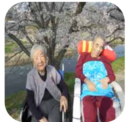
【 桜観賞（あやめ） 】