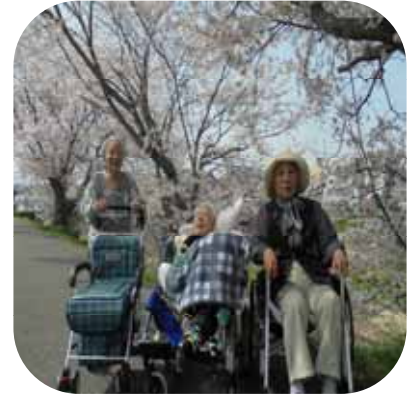
【 桜観賞（もみじ） 】