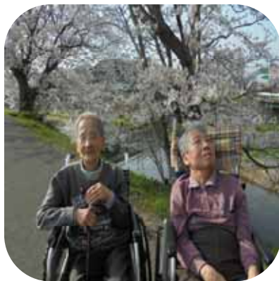
【 桜観賞（あやめ） 】