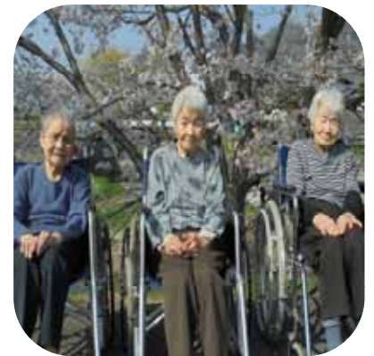
【 桜観賞（さくら） 】

今年は3月末に満開を迎え、もう既に散りかけていましたが、風が吹き、舞い降りてくる花びらを手にとられ、「やっぱり桜はええなあ」「桜吹雪が観れて、よかった」「こんな所でご飯を食べたら、美味しいやろなあ」とそれぞれの思いを語られつつ、春を肌で感じられていました。