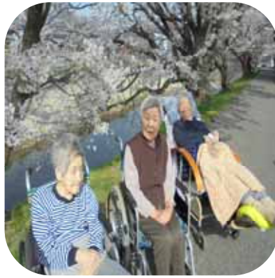
【 桜観賞（もみじ） 】