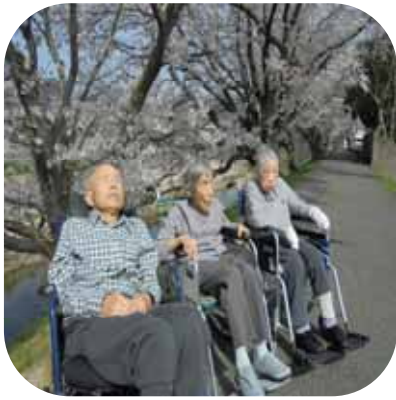
【 桜観賞（もみじ） 】