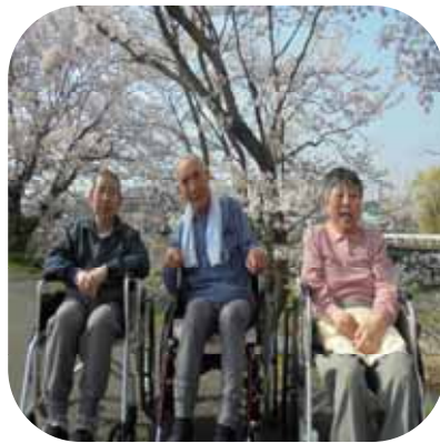
【 桜観賞（あやめ） 】