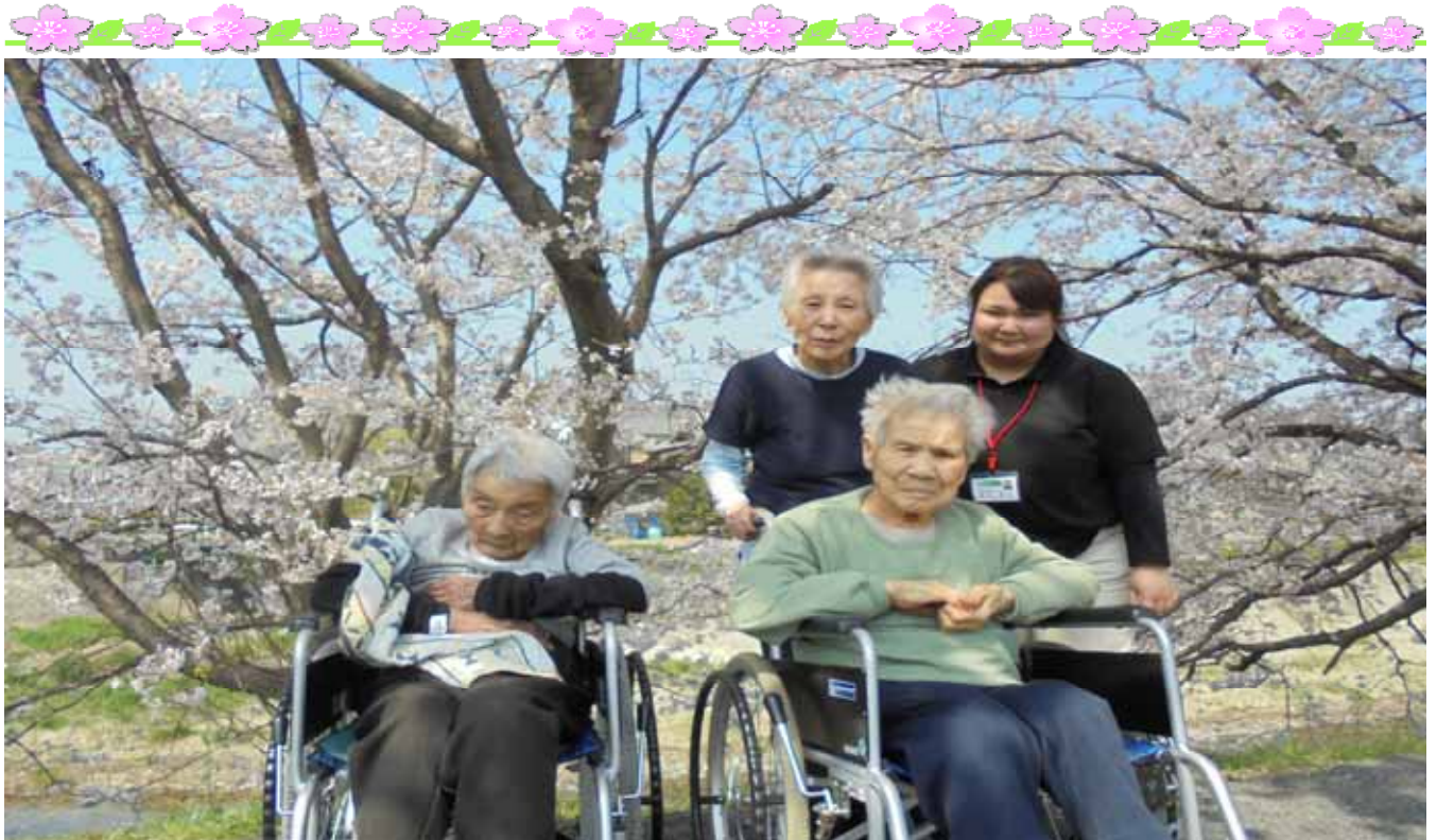
【 桜観賞（太子町太田の川島地区にて） 】