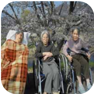
【 桜観賞（さくら） 】

4月2日と3日に太子町太田（川島地区）の大津茂川沿いまで、花見に行ってきました。