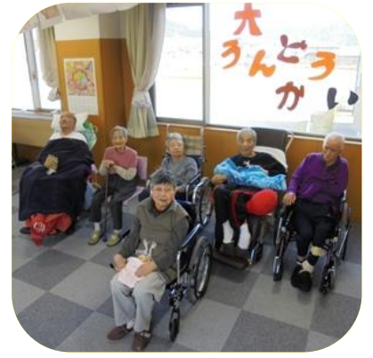
【 運動会（あやめ） 】