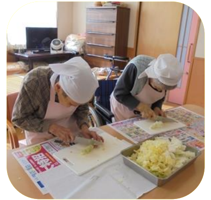
【 鍋料理（さくら） 】