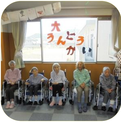
【 運動会（もみじ） 】