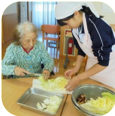
【 鍋料理（もみじ） 】