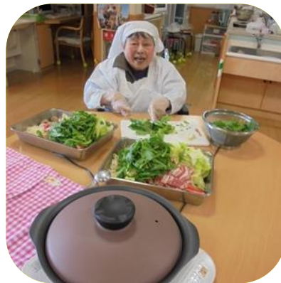
【 鍋料理（あやめ） 】