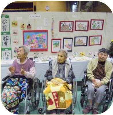
【 勝原校区ふれあい文化祭 】