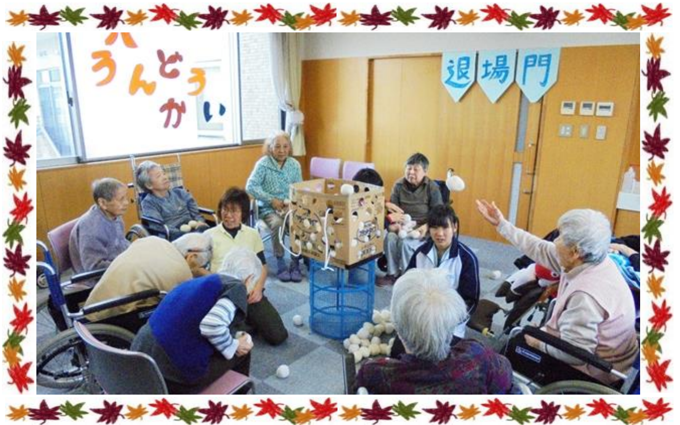
【 運動会（玉入れ） 】