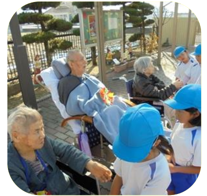
【やながせ保育園園児との交流（誕生者）】

手作りの食事は、格別のように何度もお替わりをされ、冬の味覚を堪能されていました。