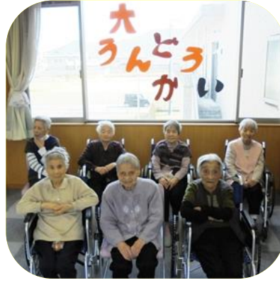
【 運動会（さくら） 】