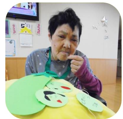
【園児からの誕生日プレゼント】