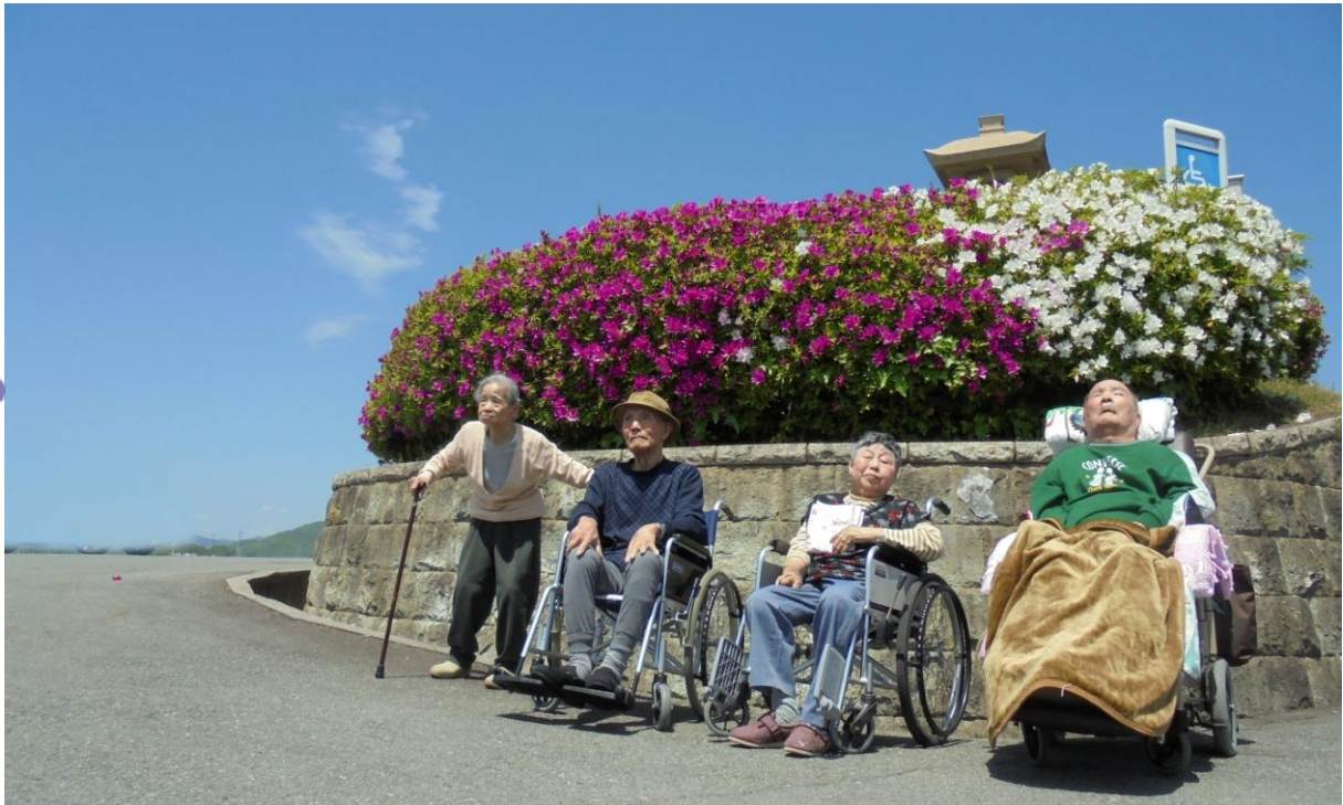
【 つつじ観賞（名古屋にて） 】

湿度が高く、うっとうしい梅雨の季節となりましたが、皆様におかれましては、ますます御健勝のこととお慶び申し上げます。