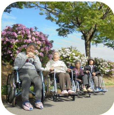
【 つつじ観賞（もみじ） 】

暖くなり、爽やかな天候の中、綺麗な花々や青く澄んだ空を見られると、利用者の皆さんの表情が普段よりも和らぎ、生き生きされているように感じられます。