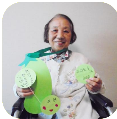
【園児からの誕生日プレゼント】