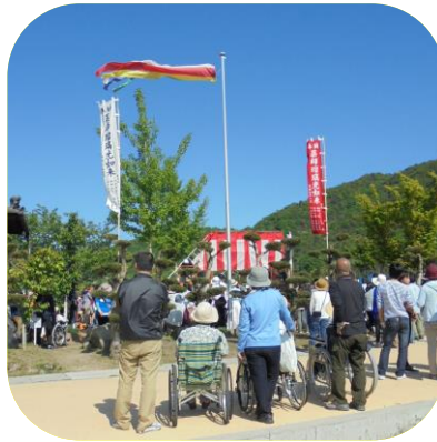
【 下太田餅まき見学 】