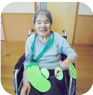
【園児からの誕生日プレゼント】