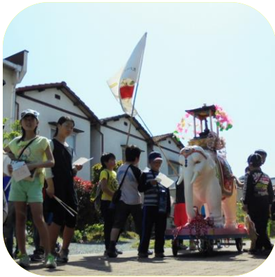
【 下太田花祭り見学 】