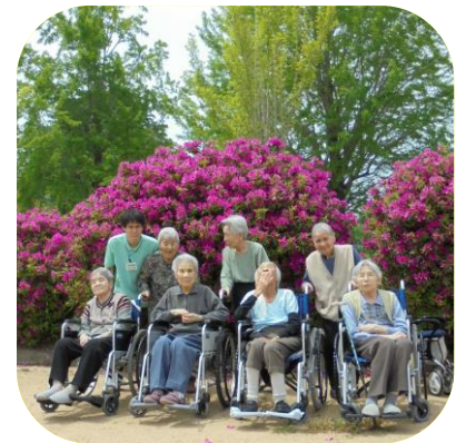
【 つつじ観賞（さくら） 】

5月は、残念ながら予定していた保育園児との交流はありませんでしたが、誕生日プレゼントをもらい、とても喜ばれていました。