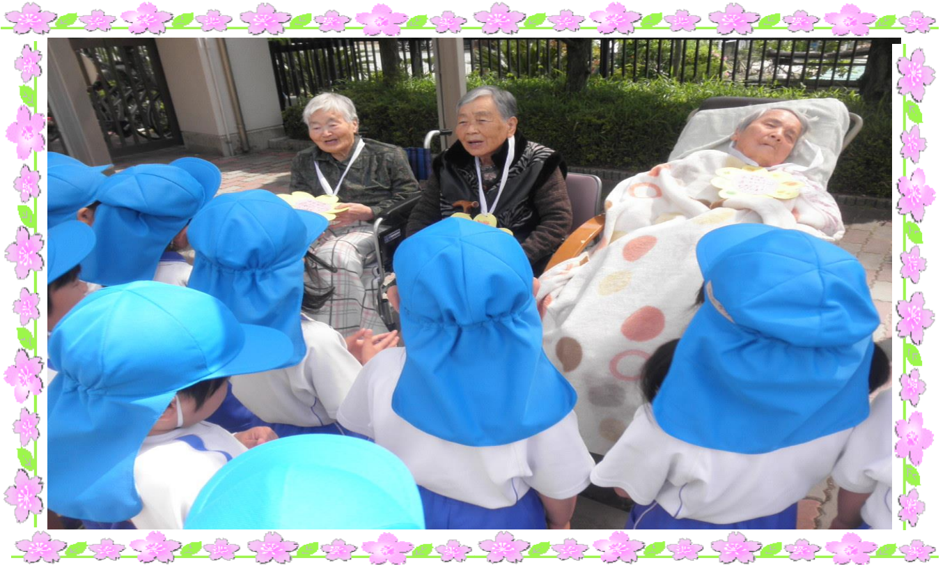
【4月誕生者とやながせ保育園園児】

若葉の候、ご家族の皆様におかれましては、ますます御健勝のこととお慶び申し上げます。